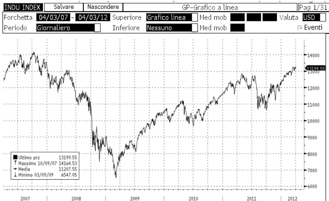
Tabella riepilogativa delle esemplificazioni inerenti i rendimenti:

Il grafico che segue illustra l'andamento del Sottostante.